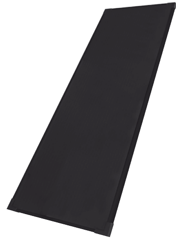
SOLARTHIN 20W - 12V