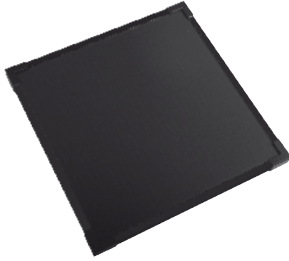
SOLARTHIN 7W - 12V