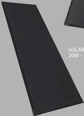
SOLARTHIN 20W - 12V