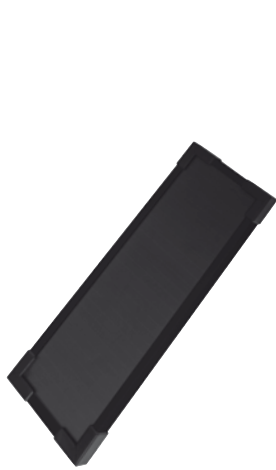
SOLARTHIN 2.5W - 12V